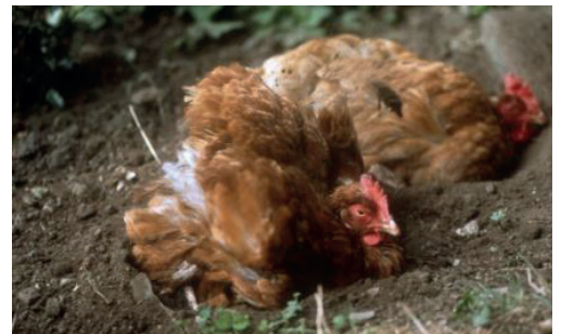
Pēršanās ir dabiska uzvedība, kas nav pienācīgi nodrošināta būros