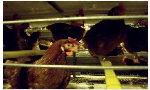
Modernizētajos sprostos vistām ir lakta, nošķirta ligzdas vieta un ierīce nagu deldēšanai, taču vieta joprojām ir ļoti ierobežota

Diemžēl būris ir un paliek būris, un tas ierobežo vistu labturību.