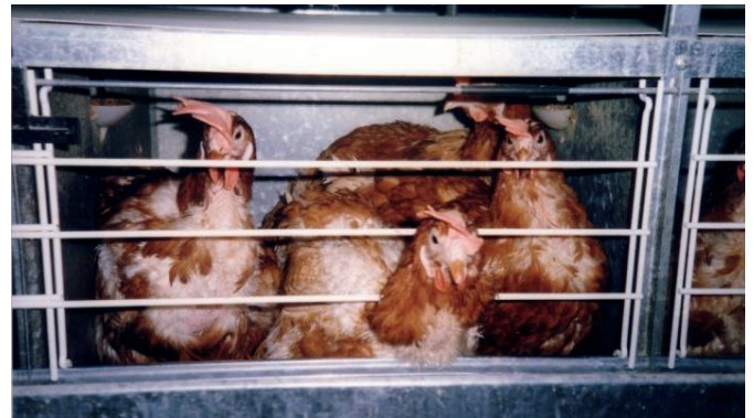
Nemodernizēts sprost – vistas nevar veikt tām raksturīgās dabiskās darbības, piem., izplest spārnus.

Pasaulē vairums industriālajā lopkopībā iegūto olu nāk no vistām, kas turētas neapriktos daudznodalījumu būros jeb nemodernizētajos sprostos. Katrā sprostā atrodas vairāki putni, un vienam putnam atvēlētā vieta ir mazāka par A4 lapu (620 cm 2 ). Piemēram, ASV vienam putnam bieži ir atvēlēts 430–550 cm 2 laukums 1 . Būrī parasti neatrodas nekas cits kā vien aprīkojums pārtikas un ūdens nodrošināšanai, un būra pamatni veido ieslīps stieples režģis, kas ļauj olām izripot laukā uz konveijera lentas, kur tās tiek automātiski savāktas.