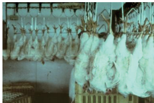
Lai nokautu, dējējvistas pakar uz konveijera lentas līdzīgi kā šos broilerus. Putnu galvas iemērc elektrizētā ūdens vannā, un pēc tam vistām pārgriež rīkli.

Vistas parasti nogalina, ūdens vannās apdullinot ar elektrošoku un tad pārgriežot rīkli vai nosmacējot ar gāzi – vai nu ar inertajām gāzēm, vai CO 2 . Kamēr putni ir pie pilnas apziņas, tos aiz kājām iekar konveijera lentas āķos. Tad tās virza cauri elektrizēta ūdens vannām, lai apdullinātu pirms rīkles pārgriešanas. Karāšanās kājām gaisā visticamāk, ir sāpīga, it īpaši, ja putni jau ir cietuši pārvešanas laikā (jāpiemin, ka mājputni ir vienīgie dzīvnieki, kurus ES ir atļauts pirms apdullināšanas saslēgt). Daļa putnu var nesaņemt elektrošoku un/vai netikt pietiekami apdullināti, pirms tiem pārgriež rīkles. Nogalinot putnus ar gāzi, putniem tiek aiztaupīts pārvietošanas stress, jo tie var palikt sprostos. Akadēmiskajās aprindās vēl tiek diskutēts, kāda gāzu koncentrācija būtu vispiemērotākā no labturības viedokļa.