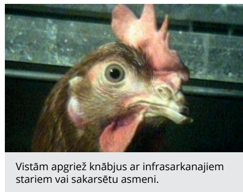
Vistām apgriež knābjus ar infrasarkanajiem stariem vai sakarsētu asmeni.